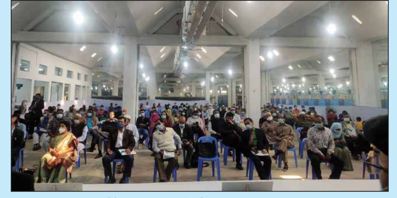
কোম্পানীর ২৬তম বার্ষিক সাধারণ সভায় পরিচালকমন্ডলী